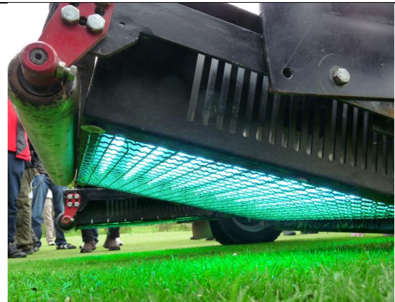
Abb.4: Belichtungseinheit des UVC-Gerätes.